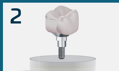
2 Disinfezione dell'abutment