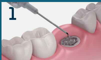
1 Disinfezione dell' impianto