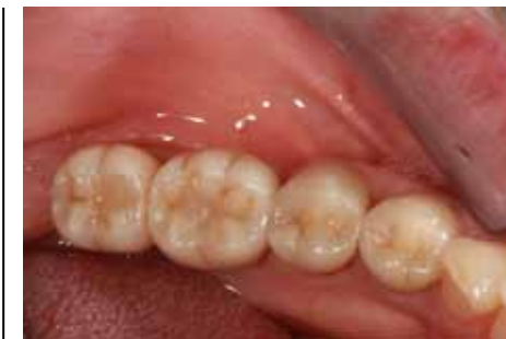
Fig 13 Particolare occlusale della protesi realizzata nel terzo quadrante. La protesi ad appoggio impiantare è direttamente avvitata, e i fori passanti sono stati sigillati con composito.