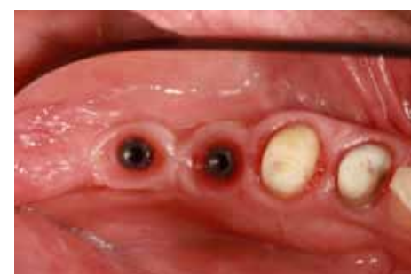
Fig 10 Ad avvenuta osteo-integrazione l'aspetto dei tessuti appare soddisfacente.