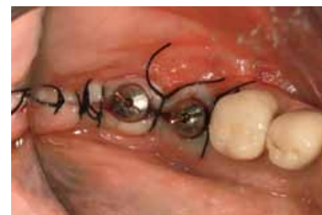
Fig 9 L'ottimo valore di torque raggiunto all'inserimento degli impianti ha permesso di optare per una tecnica semi-semmersa.