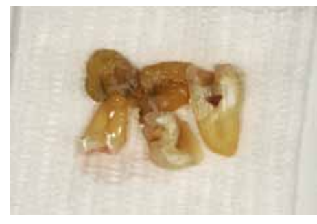
Fig 4 I segmenti radicolari e coronali disponibili vengono sezionati; nella foto sono visibili prima della pulizia superficiale, della completa rimozione dei materiali estranei e dell'ulteriore sezionamento.