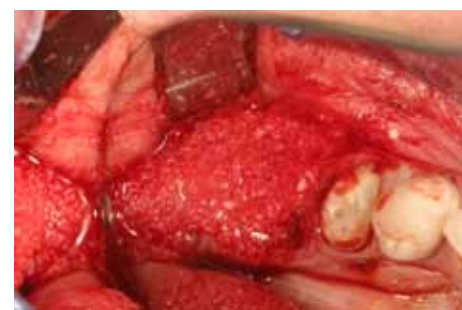
Fig 6 Si opta per una tecnica di ridge-preservation, inserendo il materiale ottenuto negli alveoli e al di sopra della cresta ossea. Il particolato viene ricoperto con una membrana riassorbibile.

Il controllo radiografico finale dimostra una buona integrazione degli impianti osteointegrati (Fig 15). La paziente aveva purtroppo rifiutato il rifacimento di restauri protesici incongrui nei quadranti superiori ed inferiori di destra in quanto lavori eseguiti poco tempo prima presso altro studio.