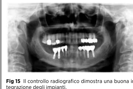
Fig 15 Il controllo radiografico dimostra una buona integrazione degli impianti.