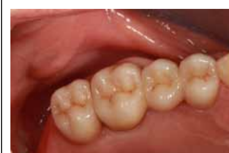
Fig 14 Particolare occlusale della protesi realizzata nel secondo quadrante.