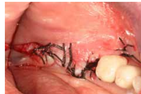
Fig 7 Previo scollamento si procede alla sutura per chiudere il sito completamente per ottenere una guarigione di prima intenzione.

Il controllo radiografico finale dimostra una buona integrazione degli impianti osteointegrati (Fig 15). La paziente aveva purtroppo rifiutato il rifacimento di restauri protesici incongrui nei quadranti superiori ed inferiori di destra in quanto lavori eseguiti poco tempo prima presso altro studio.