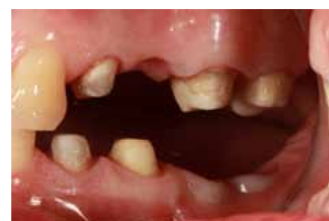
Fig 11 Visione laterale al momento della presa delle impronte per le protesi definitive (provvisori sui denti erano stati posizionati precedentemente).