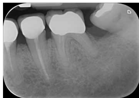
Fig 2 Ad un esame radiografico iniziale non si evidenziano lesioni ossee. La corona sul 36 viene ricementata e la paziente messa in un programma di mantenimento.