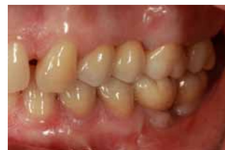
Fig 12 Visione laterale delle protesi definitive su denti e impianti realizzate in zirconia monolitica sugli elementi molari e parzialmente stratificata sui premolari. (si ringrazia il Laboratorio Odontotecnico Carlo Besana, Bernareggio)