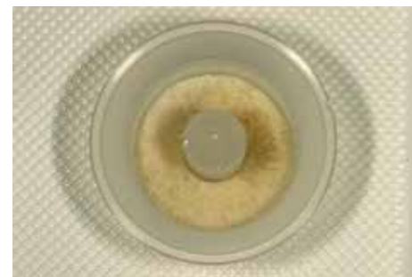
Fig 5 Dopo avere pulito la superficie esterna e rimosso ogni traccia di guttaperca e materiale da ricostruzione degli elementi dalla triturazione viene ottenuta una grande quantità di particolato.